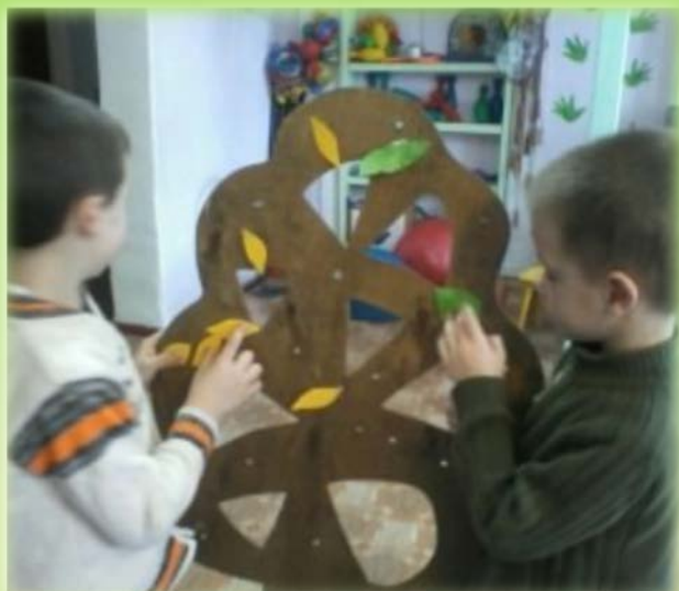
Работа с макетами