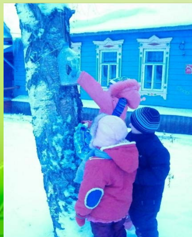
Акция «Птичья столовая»