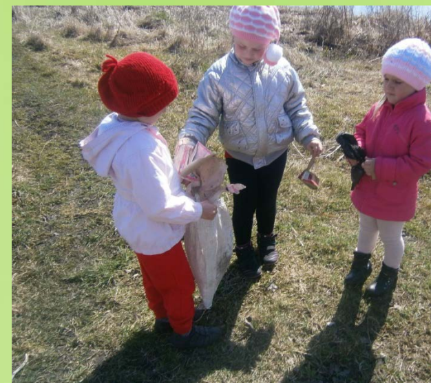
Заботимся о чистоте водоема