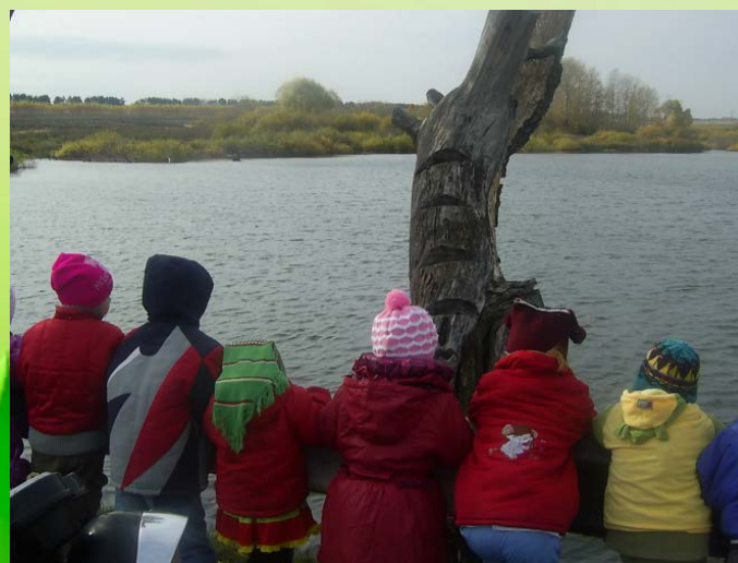
Экскурсия на водоем