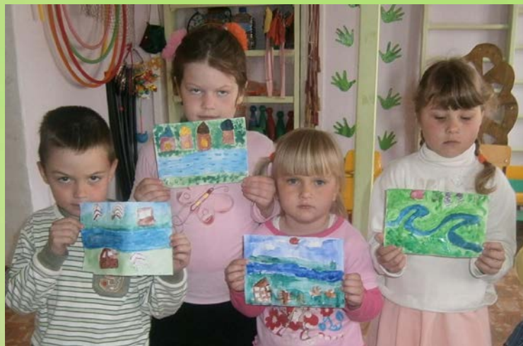
Реки на наших рисунках