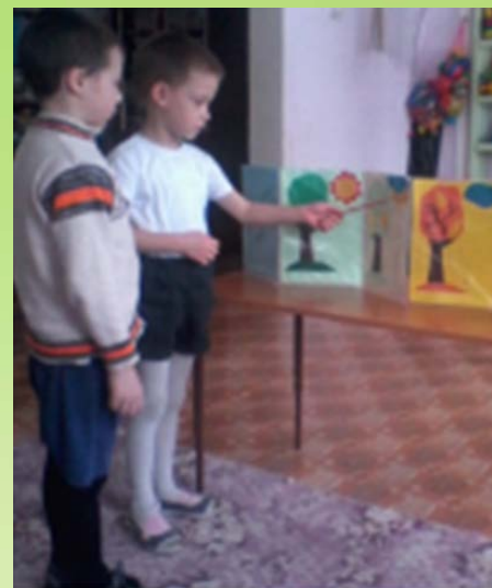
Работа со схемами