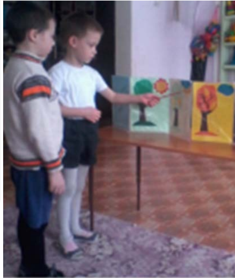
РАБОТА С ПАПКОЙ- ПЕРЕДВИЖКОЙ «КАК ЖИВЕТСЯ ТЕБЕ, ДЕРЕВЦЕ?»