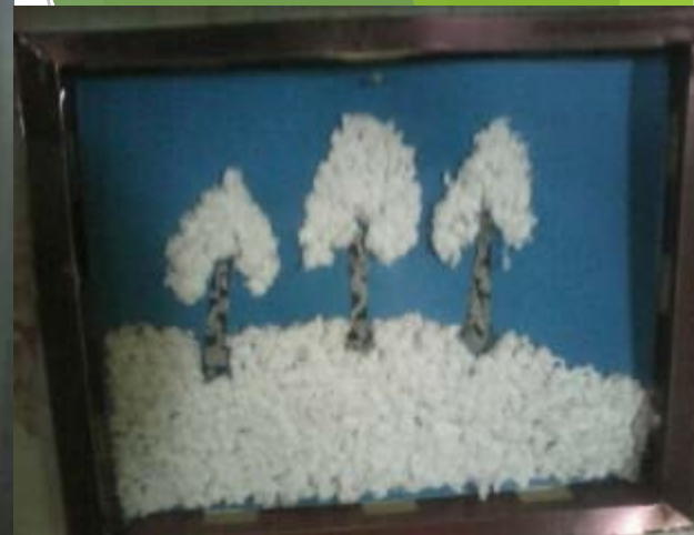
ДЕРЕВЬЯ НАШЕГО УЧАСТКА В РАЗНОЕ ВРЕМЯ ГОДА