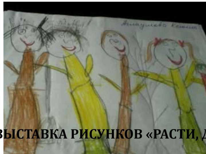
ВЫСТАВКА РИСУНКОВ «РАСТИ, ДЕРЕВЦЕ»