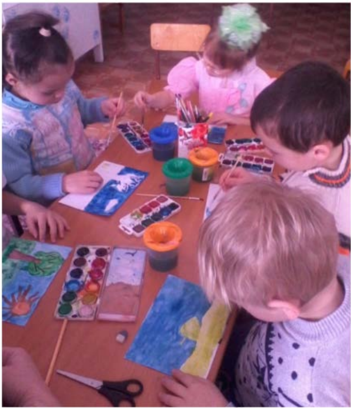
РИСУЕМ СКАЗКУ «ПУТЕШЕСТВИЕ ЛИСТОЧКА»