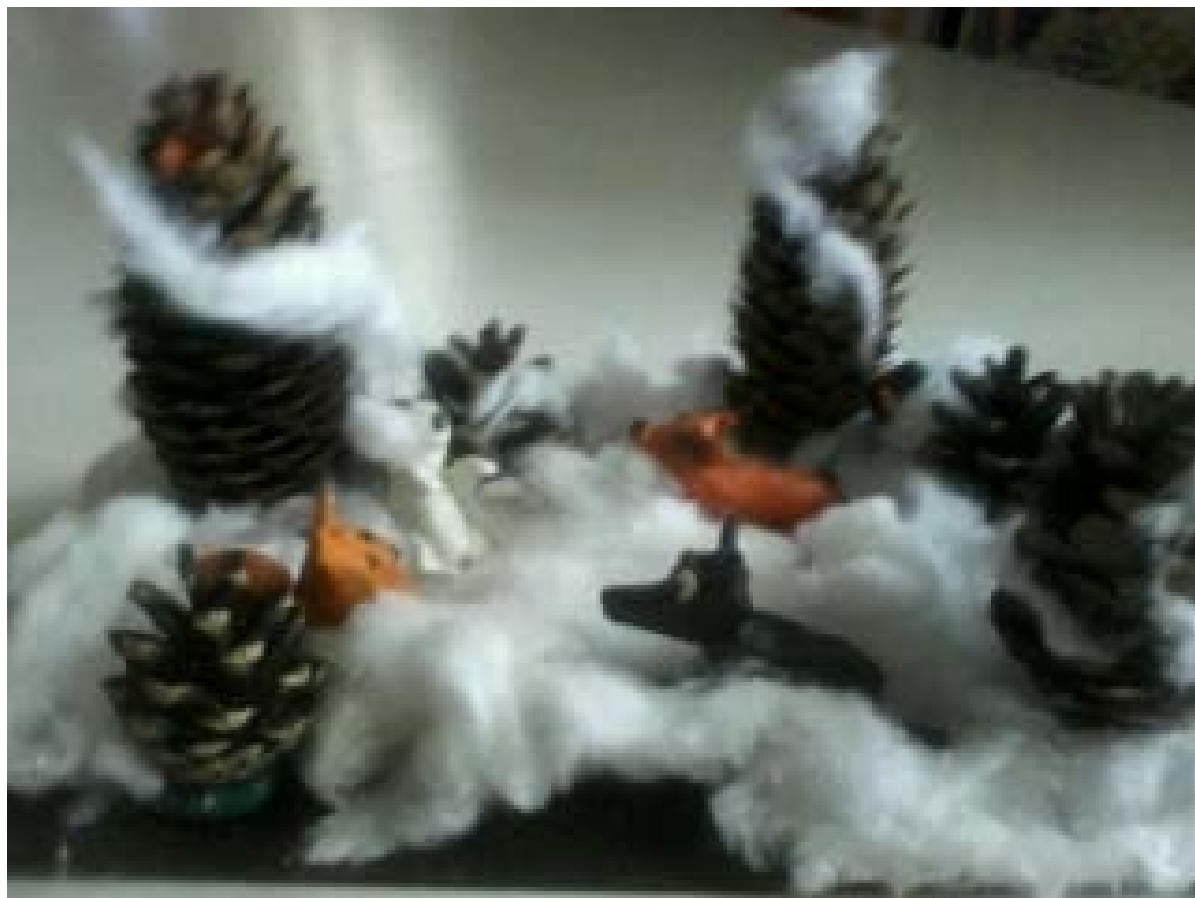
КАК ЗИМУЮТ ДИКИЕ ЖИВОТНЫЕ