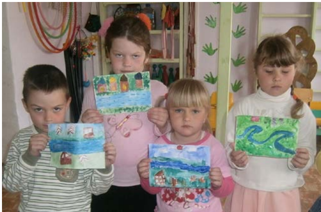
Реки на наших рисунках