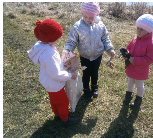
Заботимся о чистоте водоема