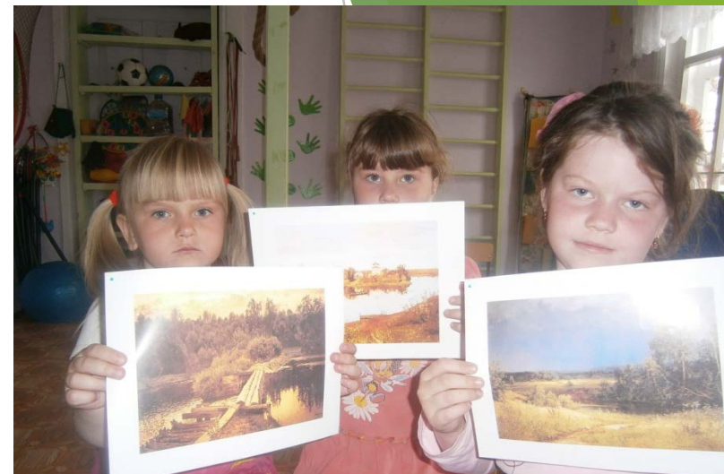
Реки на картинах известных художников