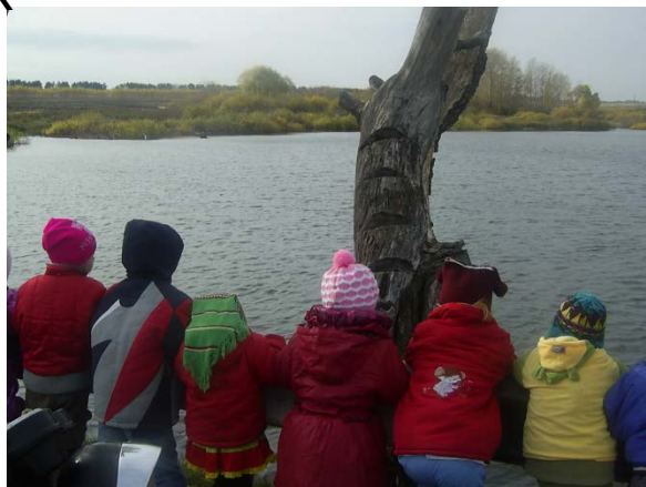
Экскурсия на водоем