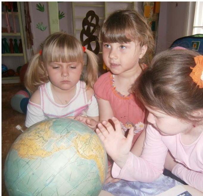
Реки нашей планеты